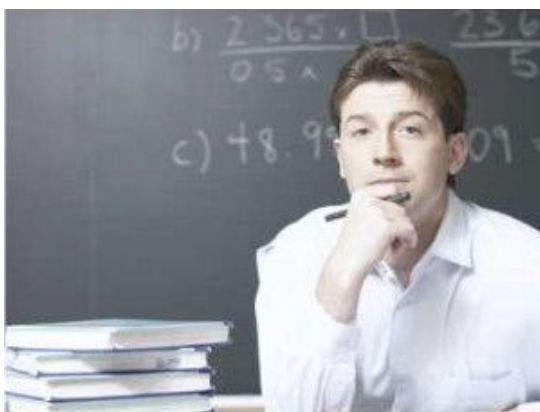
Figura 1: Docente UnP.