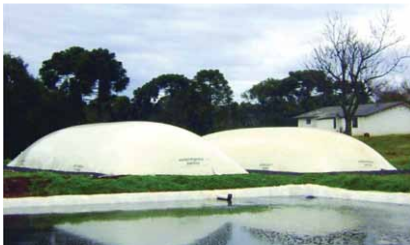
Figura 2: Imagem de um Biodigestor contínuo Sansuy