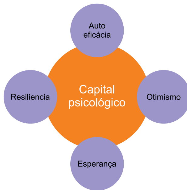
Figura 2: Modelo teórico do capital psicológico

Fonte: (LUTHANS; LUTHANS; LUTHANS, 2004)