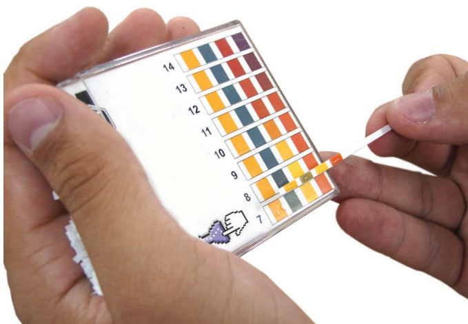
Figura 1- Indicação no papel de tornassol

O papel de pH foi mergulhado nas amostras em parte da amostra para evitar contaminação, por um período de 5min para observação da escala apropriada, indicadora do pH da gasolina. Na escala de 0-7 a gasolina é considerada ácida; em 7, neutra; entre 7 e 14, básica.