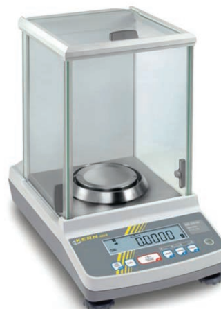
Figura 2- Medição da massa do fluido na Balança Analítica

Pesou-se um picnômetro vazio de 50mL e anotou-se a massa. Inseriu-se neste picnômetro água destilada, que já tem densidade conhecida de 1g/ml.